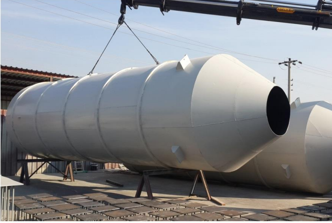
Silo İmalatı / Silos Production