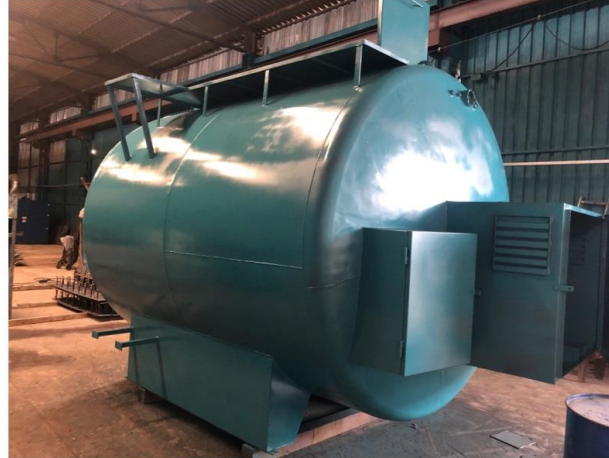
Pis Su Tankı / Waste Water Tank