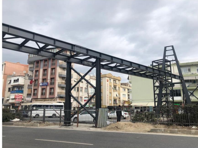
MENEMEN Üstgeçit Köprüsü 100_Ton