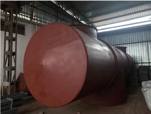
Havalandırma Tesisatı İmalatı / Ventilation Pipe Production