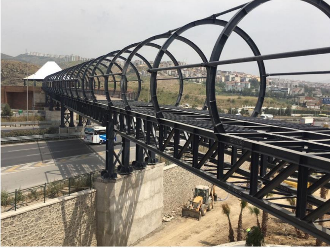
WESTPARK Üstgeçit Köprüsü 350_Ton