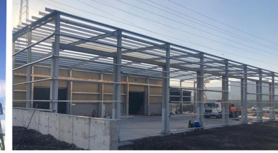
Cem Demir - 50_Ton