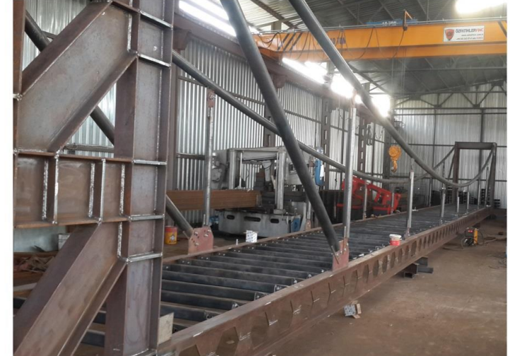
Yaya Üstgeçit Köprüsü 25_Ton