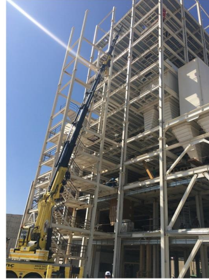
Çamlıyem - 1.750_Ton

* Diğer referanslarımız için lütfen bilgi alınız Please get information for our other references