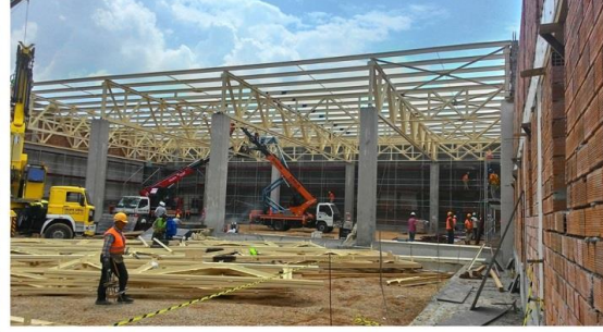
JTI - 250_Ton