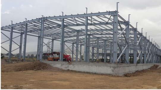
Cihan Etiket - 400_Ton