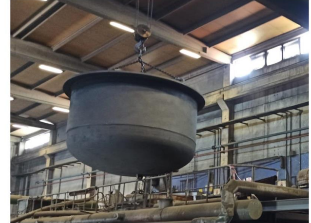
Döküm Potası İmalatı / Casting Crucible