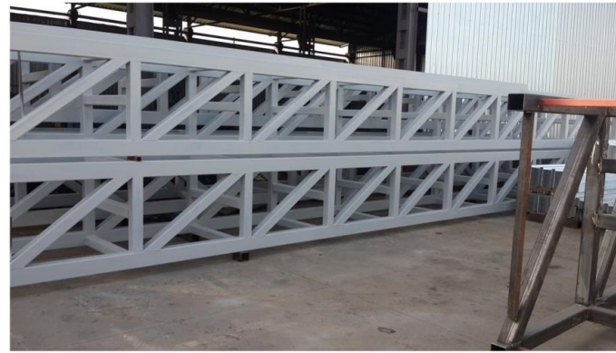
Boru Taşıyıcı Köprü / Pipe Carrier Bridge